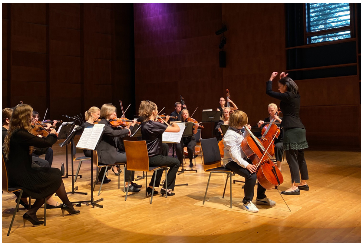
Wegelius Unga Solister 8.10.2023