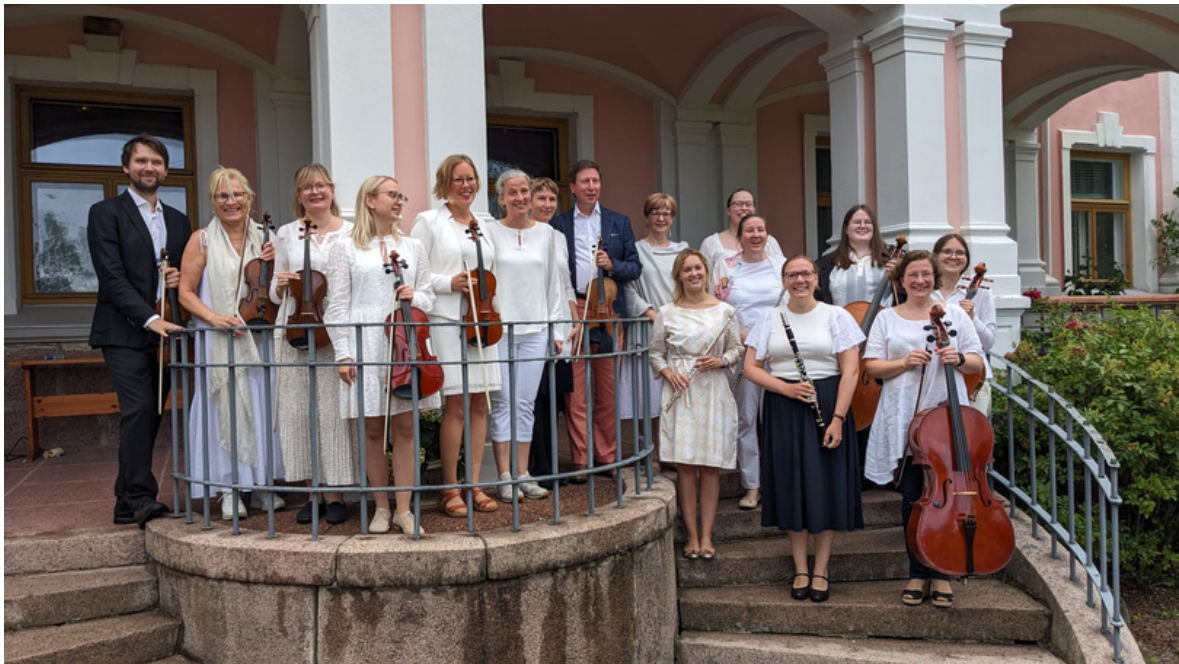
Stor-Sarvlax gård 4.8.2023