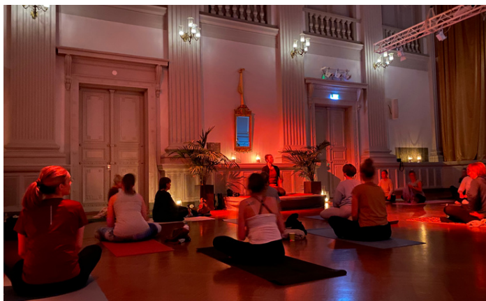
Yoga till levande musik jan-mars 2023